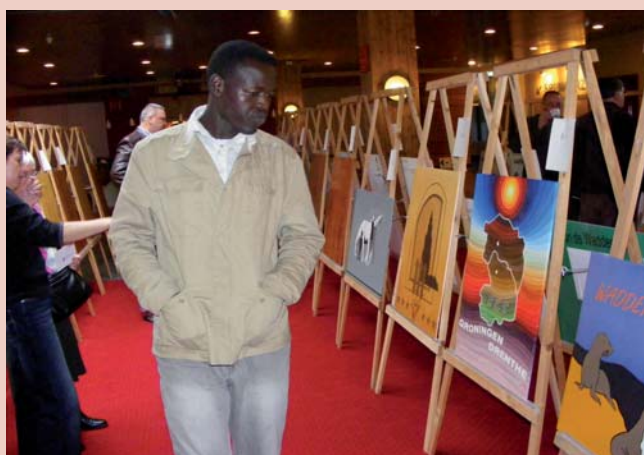
De aanwezigen konden tussendoor alle ingezonden werkstukken van de vakwedstrijd bewonderen.

Meer foto's in de ePaper op www.schildersblad.nl